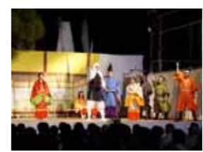
弁慶まつり (田辺市) 10月第1金曜日・土曜日