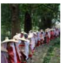
あげいん熊野詣 (那智勝浦町) 10月4週目の日曜日