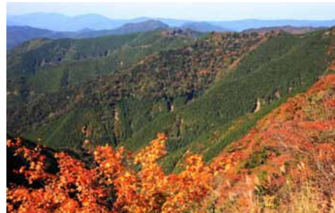
護摩壇山 (田辺市) 雄大な原生林が広がる護摩壇山は、ブナなどの木々が紅葉します。山頂近くにあるスカイタワーからは、紀州の山々を一挙に展望することができます。