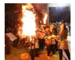
稲むらの火祭り (広川町) 10月21日