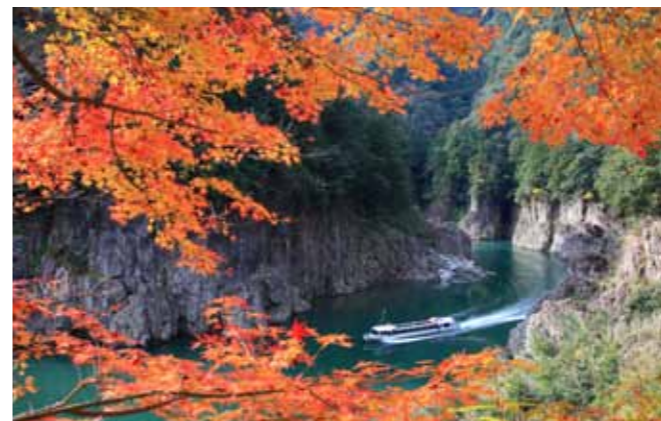
湊峡 (新宮市・北山村) 太古の自然がそのまま息づいているような渓谷美をウォータージェット船から見渡せます。船上からは、神秘的なコバルトブルーの水と荒々しく切り立つ断崖と巨岩、そして色鮮やかな紅葉の風景は圧巻です。