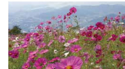
鷲ヶ峰コスモスパーク (有田川町) 遠く淡路島、四国まで見渡せる360度の大パノラマが望めます。一面コスモスの花が咲く人気スポット。