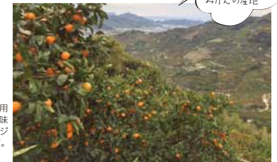
みかん畑 (有田地方) 初秋、急傾斜地を利用した段々畑では、美味しいみかんがオレンジ色に色付きはじめます。