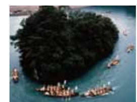
御船まつり (新宮市) 10月16日