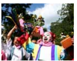
笑い祭 (日高川町) 10月8日