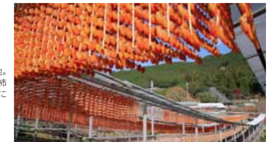
串柿の里 四郷 (かつらぎ町) 日本一の串柿の産地。晩秋、茜色に輝く串柿の玉のれんが、一斉に吊るされます。