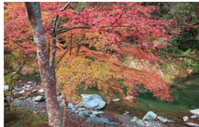
玉川峡 (橋本市・九度山町) 奇石と大小さまざまな滝がある渓谷は、澄んだ清流と楓・ツタなど様々な紅葉とのコントラストが美しい。